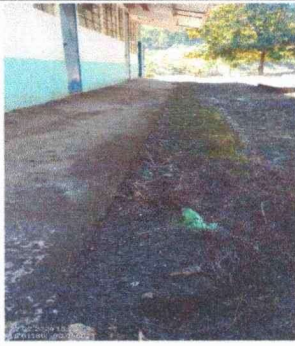
Foto1: Ampliación de losa de patio